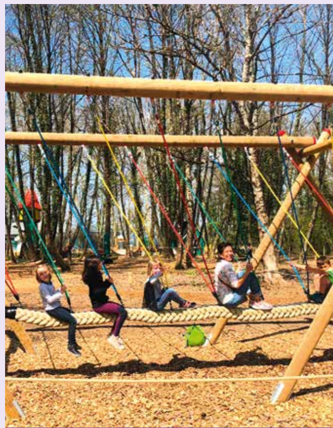
Tikouli fait son Printemps (avril) / Sortie au parc de loisirs "la crique à Saint-Jorrioz"

La commune est une des seules sur le territoire à ouvrir son accueil de loisirs dès la petite section.