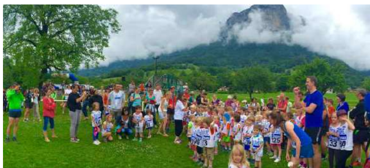
Le Dingo Trail avec toujours plus de Dingiens et d'extérieurs!