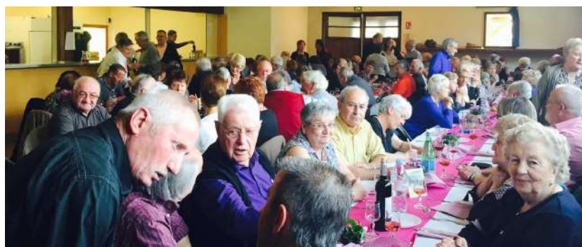
Le Bal des Aînés : nos Anciens ont dansé toute l'après midi et soirée. Une forme que nos jeunes peuvent leur envier c'est certain!