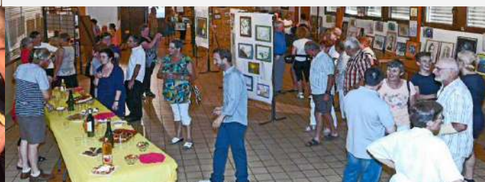
Vernissage Peinture (Foyer Parmelan) le jour de la kermesse de l'école (Aped): un afflux profitable à tous.