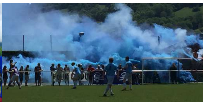
Le Football Club de Dingy lors du match contre Villaz pour tenter de passer à la division supérieure. Bravo pour l'esprit sportif!