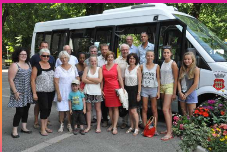
L'ensemble des 4 communes inaugure la nouvelle navette le long du parcours qui relie Thônes /Thuy/la Balme /Dingy /Alex le 6 juillet dernier.

départ CHESENEY 13h32 / PROVENAT 13h33 / PLACE DU VILLAGE 13h35 / CHEZ COLLET 13h37. Retour: 17h20 depuis Thônes