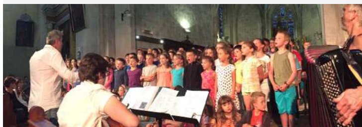
Foyer Du Parmelan à l'Eglise, avec l'Aped et les enfants des écoles ici pour la Chorale des enfants et des adultes sur « La Maison Monde », des concerts en plus petit comité ensuite dans les chapelles.