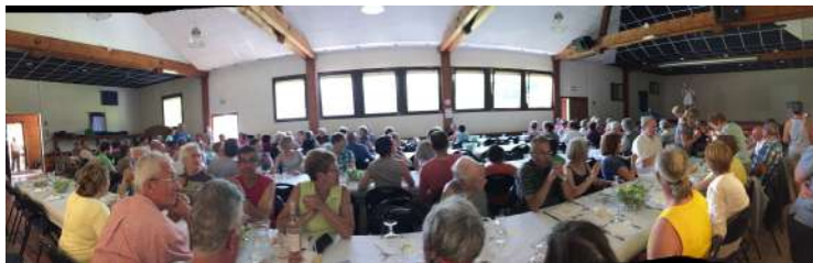
Randonneurs du La Cha. Une Journée de la Randonnée avec de très nombreux randonneurs venus d'un peu partout découvrir Dingy!

Toutes les tranches d'âges ont pu profiter du dynamisme de nos associations ces derniers mois, ce qui continuera, au vu des réservations annuelles des salles par les associations pour 2016. Petit retour en images sur leurs actions passées.