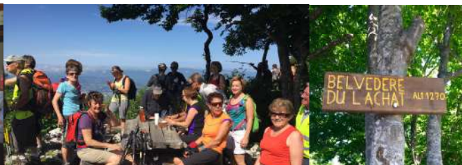
Le Belvédère du Lachat: un lieu à découvrir ou redécouvrir (informations en mairie)