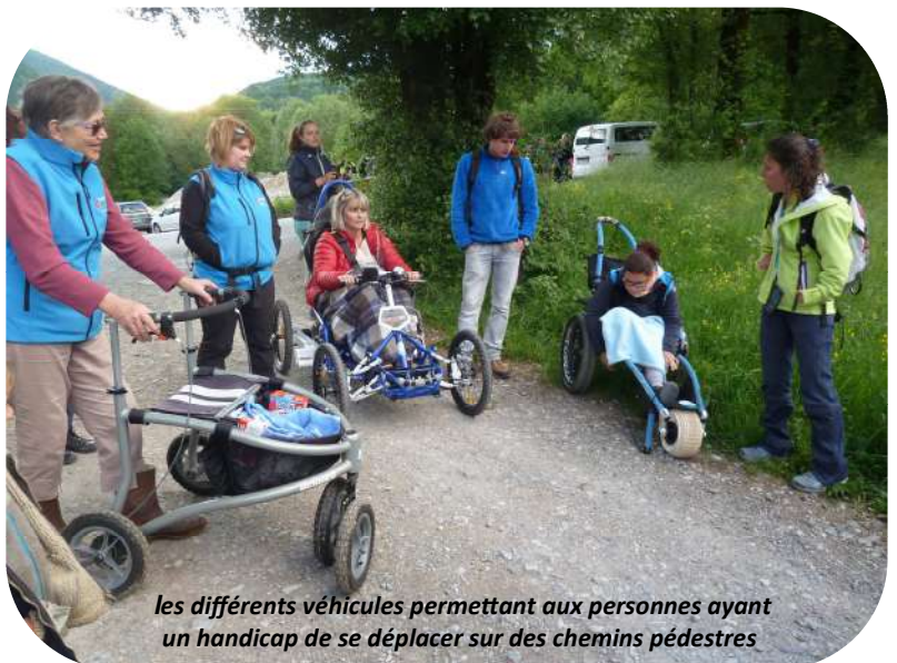
les différents véhicules permettant aux personnes ayant un handicap de se déplacer sur des chemins pédestres