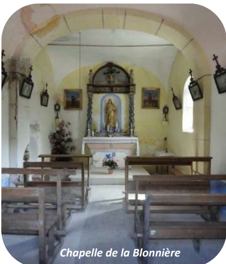
Chapelle de la Blonnière