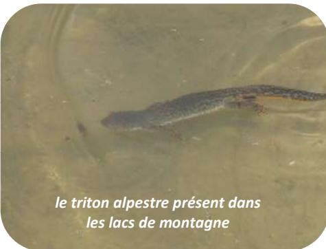
le triton alpestre présent dans les lacs de montagne

Le Conseil Général a acquis les terrains du lit majeur du Fier, afin de préserver un espace naturel ayant pour but la conservation des espèces, mais également pour conserver une zone mobile du Fier, afin de prévenir tout risque de débordement en aval. Ainsi cette zone sert notamment de couloir de passage pour les animaux (mammifères et oiseaux) et de zone de reproduction pour des espèces sensibles. La thématique particulière de la soirée étant les amphibiens, nous avons donc appris les différentes espèces présentes et les différences entre les deux grandes familles d'amphibiens.