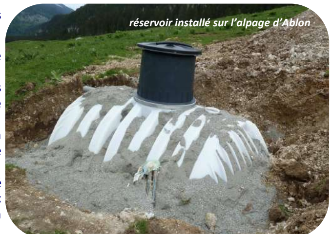
réservoir installé sur l'alpage d'Ablon

Cette année, un nouveau réservoir d'eau de 8 m 3 a été installé afin d'alimenter les bassins des animaux et le chalet. Ces travaux ont été réalisés en même temps que la piste forestière par la même entreprise.