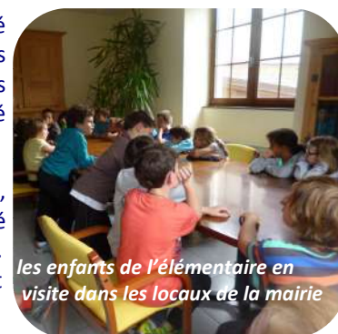
les enfants de l'élémentaire en visite dans les locaux de la mairie

Nous vous présenterons en détail les nouveaux élus et leur projet lors du prochain bulletin.