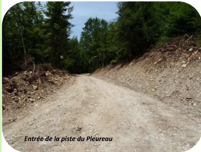
Entrée de la piste du Pleureau